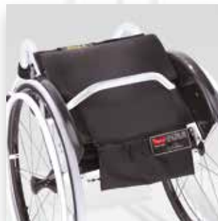
Schienale abbattibile Folding down back-rest