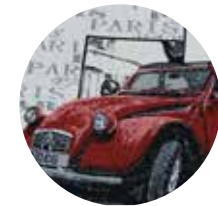
Auto Parigi Paris Car