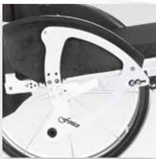
Nuovo sistema di regolazione SHS New SHS system