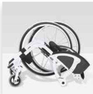
Minimo ingombro Takes up less space