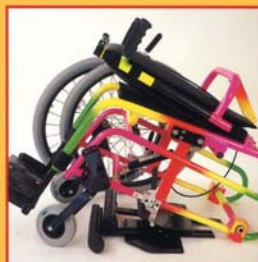
Minimo ingombro. Minimum bulk.