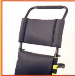
Appoggiatesta imbottito. Padded headrest.