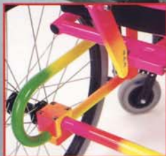
Variazione manuale dell'inclinazione. Manual adjustment of the inclination.