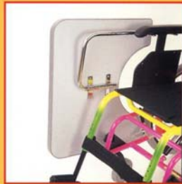
Tavolo ribaltabile (sia in plexiglass che in plastica). - Tilting table (either in plexiglass or in plastic).