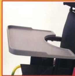
Tavolo in plastica. Plastic table.