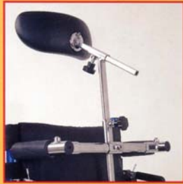
Appoggiatesta orbitale. Orbital headrest.