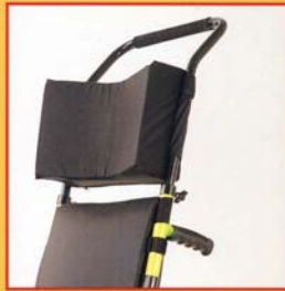
Appoggiatesta con protezioni parietali. - Headrest with parietal protections.