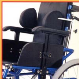
Spinte laterali e braccioli regolabili in altezza. Side pushers and armrests adjusted in height.