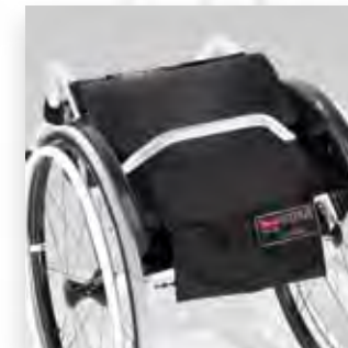
Schienale abbattibile. Folding down back-rest.