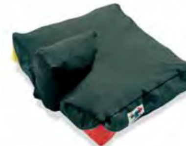
Academy Junior Adjuster