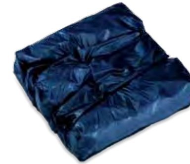
Academy Vector Disponibile anche junior Also available in junior size