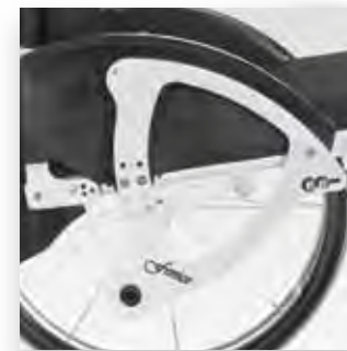
Nuovo sistema di regolazione SHS. New SHS system.