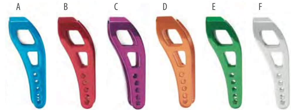
(A) azzurro, (B) rosso, (C) viola ciclamino, (D) arancio, (E) verde, (F) argento (A) light blue, (B) red, (C) cyclamen purple, (D) orange, (E) green, (F) silver