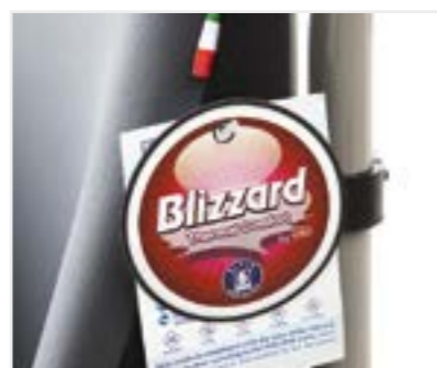
nuovo rivestimento altamente traspirante e sanificato new high breathable and sanitized fabric