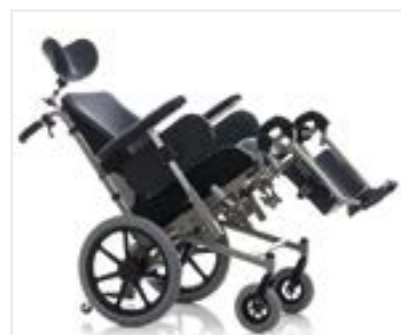
versione con sedile e schienale elettrici version with seat and backrest electrics