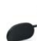
Spinta tronco destra e sinistra Lateral support pad