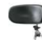
Appoggiatesta polifunzionale Polyfunctional headrest