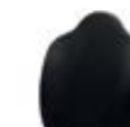
Schienale conformato Shaped backrest