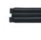
Fascione poggia gambe (h 15cm) 15cm Calf pad