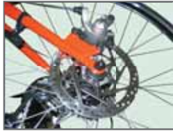
Freno a disco