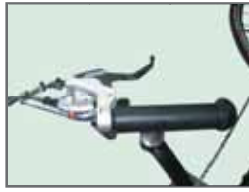
Cambio sulla manopola

Gruppo cambio Shimano XT a 27 rapporti con guarnitura a 3 corone da 22-32-44 denti, abbinata ad una cassetta a 9 pignoni: serie 11-12-14-16-18-21-24-28-32 oppure serie 12-13-14-15-16-17-19-21-23.