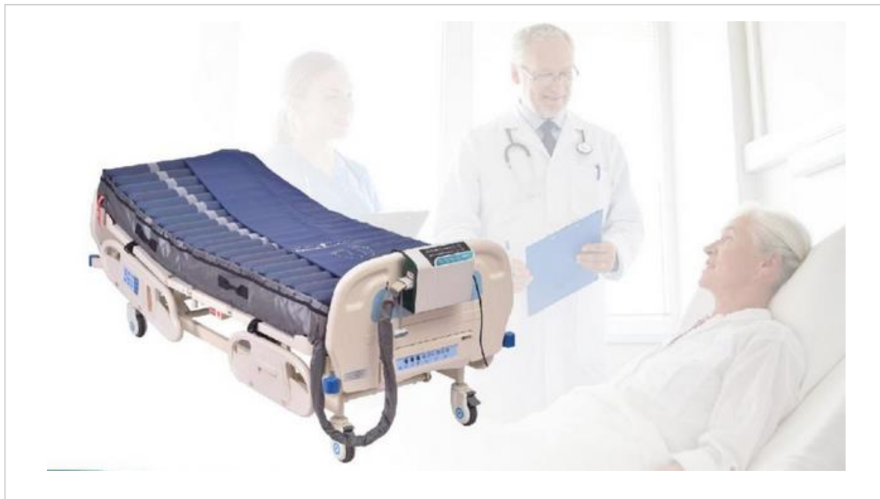
Foto puramente indicativa del kit posizionato su letto ospedaliero