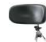
Appoggiatesta polifunzionale Polyfunctional headrest