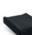
Sedile sagomato imbottito Shaped seat