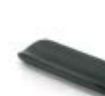
Bracciolo emiplegico Armrest for hemiplegic