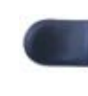
Appoggiatesta polifunzionale imbottito Polyfunctional padded headrest