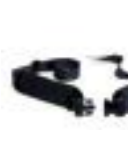
Cintura pelvica grande Big size pelvis belt