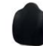
Schienale conformato Shaped backrest