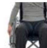
Divaricatore a fascia Belt abductor