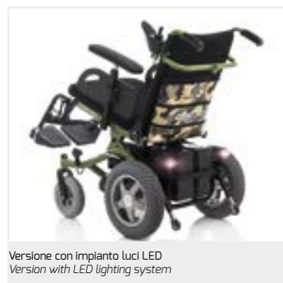
Versione con impianto luci LED Version with LED lighting system