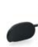
Spinta tronco destra e sinistra Lateral support pad