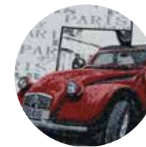
Auto Parigi Paris Car