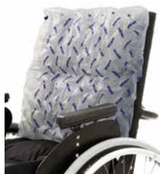
VICAIR LIBERTY BACK SYSTEM