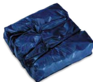
Academy Vector Disponibile anche junior