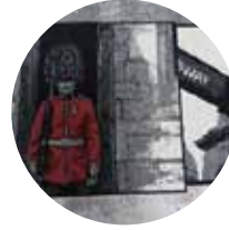
Guardia Londra London Guard