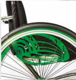
Supporto spondina dall'esclusivo design predisposta per regolare l'inclinazione dello schienale. New design clothes guard support suitable for back-rest tilt set-up.