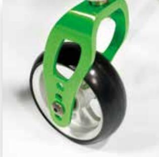
Particolare forcella con set colorato. Front fork.