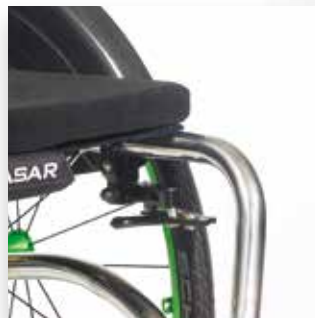
Freni a scomparsa. Scissor brake.