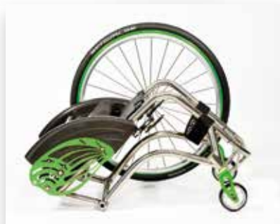
Minimo ingombro. Takes up less space.