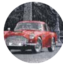
Auto Londra London Car