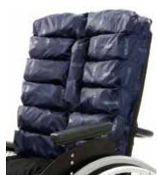
VICAIR ACADEMY ANATOMIC