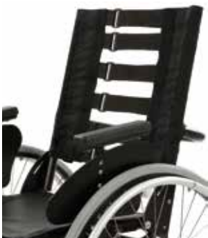
VICAIR ACADEMY STRAP BACK