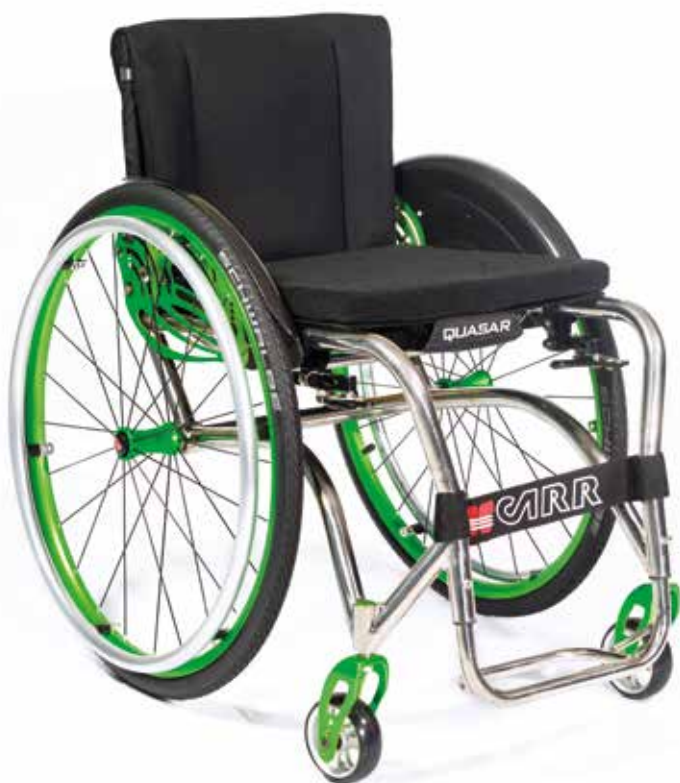
Quasar con asse fisso Quasar with fixed centre of gravity axle