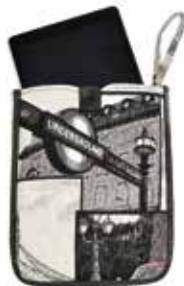
Porta Ipad Ipad sleeve