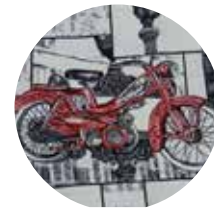
Moto Parigi Paris Motorcycle