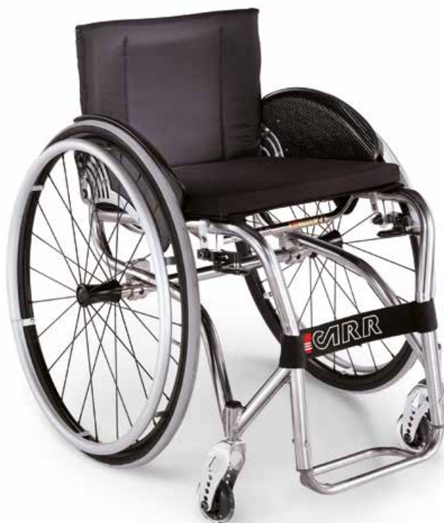
Quasar con asse regolabile Quasar with adjustable centre of gravity axle