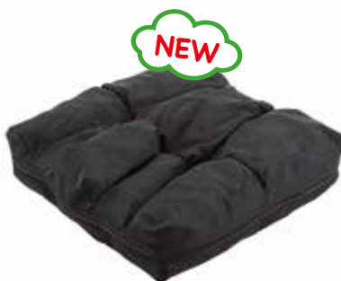
Academy Vector O2