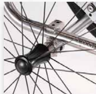
Asse regolabile. Adjustable centre of gravity axle.