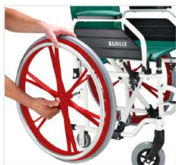
Extractable big wheels

Itala ISO class: 12.21.06.039 + 12.24.03.121 Superitala ISO class: 12.21.06.039 + 12.24.03.121 + 12.24.21.106