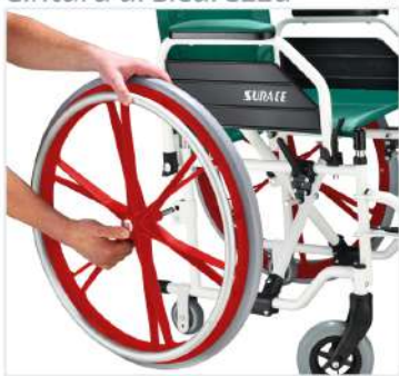
Ruote ad estrazione rapida

...e SUPERITALA con ruote pneumatiche ad estrazione rapida e ruote ascensore, in versione antracite di serie.