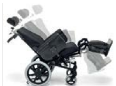
Sistema ad assorbimento con unica molla regolabile su 3 intensità Absorption system with a single spring operating in 3 situations of torso-pelvis shift

Seggiolone polifunzionale dinamico, studiato per garantire l'assorbimento di eventuali startles in estensione, di movimenti distonici e coreici. Il seggiolone bascula da 0° a 40°. I sistemi di regolazione multipla e il freno a tamburo di cui è dotato offrono massimo comfort e stabilità in sicurezza. Sistema di accoglienza privo di punti di rischio.