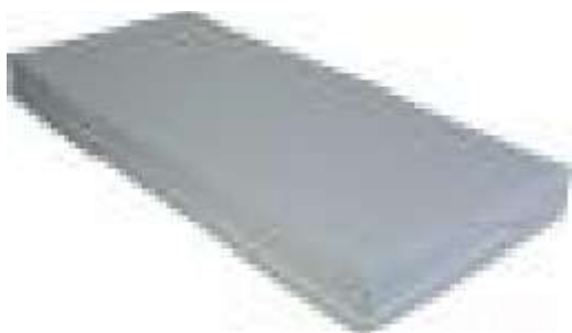
mod. F10-IG / F14-IG Fodera IGNIFUGA