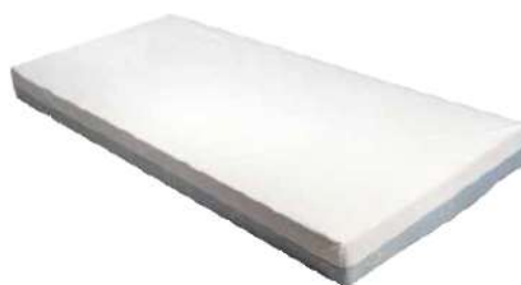
mod. F10-I / F14-I Fodera Impermeabile e Traspirante