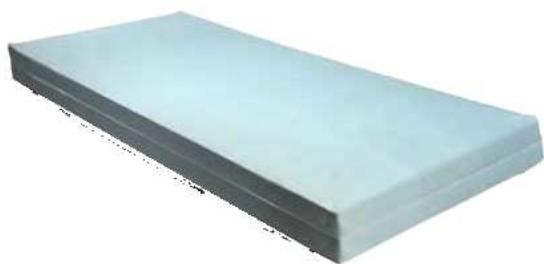
mod. F10 / F14 Fodera di Cotone