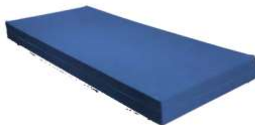
mod. F10-IG-I / F14-IG-I Fodera IGNIFUGA Impermeabile e Traspirante