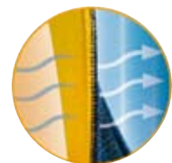
100% COTONE SULLA PELLE

Lo strato a contatto con la pelle è composto da un velluto di cotone 100%, confortevole al tatto, che garantisce alla pelle la libera traspirazione. Lo strato esterno è costituito da una maglia di nylon resistente sulla quale aderiscono perfettamente le bande di velcro del sistema di chiusura.