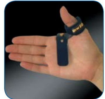
New RIZOFIX System

Innovativo sistema di immobilizzo del pollice RIZOFIX, brevettato a livello internazionale. Esclusivo tessuto anallergico e traspirante, 100% cotone sulla pelle Colore blu.