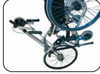
Applicazione dell' Easybike ad una carrozzina