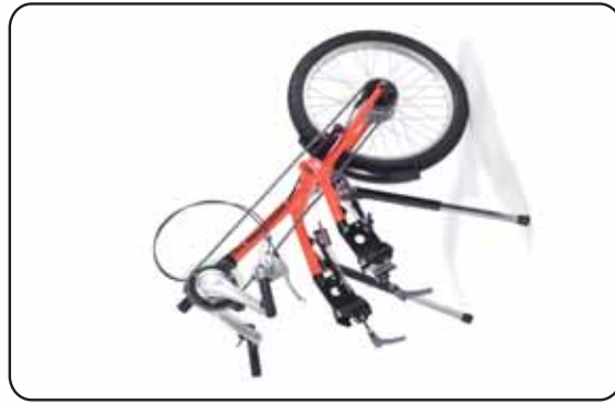
EASYBIKE 8F KID