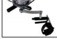
Manopola di spinta per tetraplegici