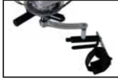
Manopola di spinta per tetraplegici